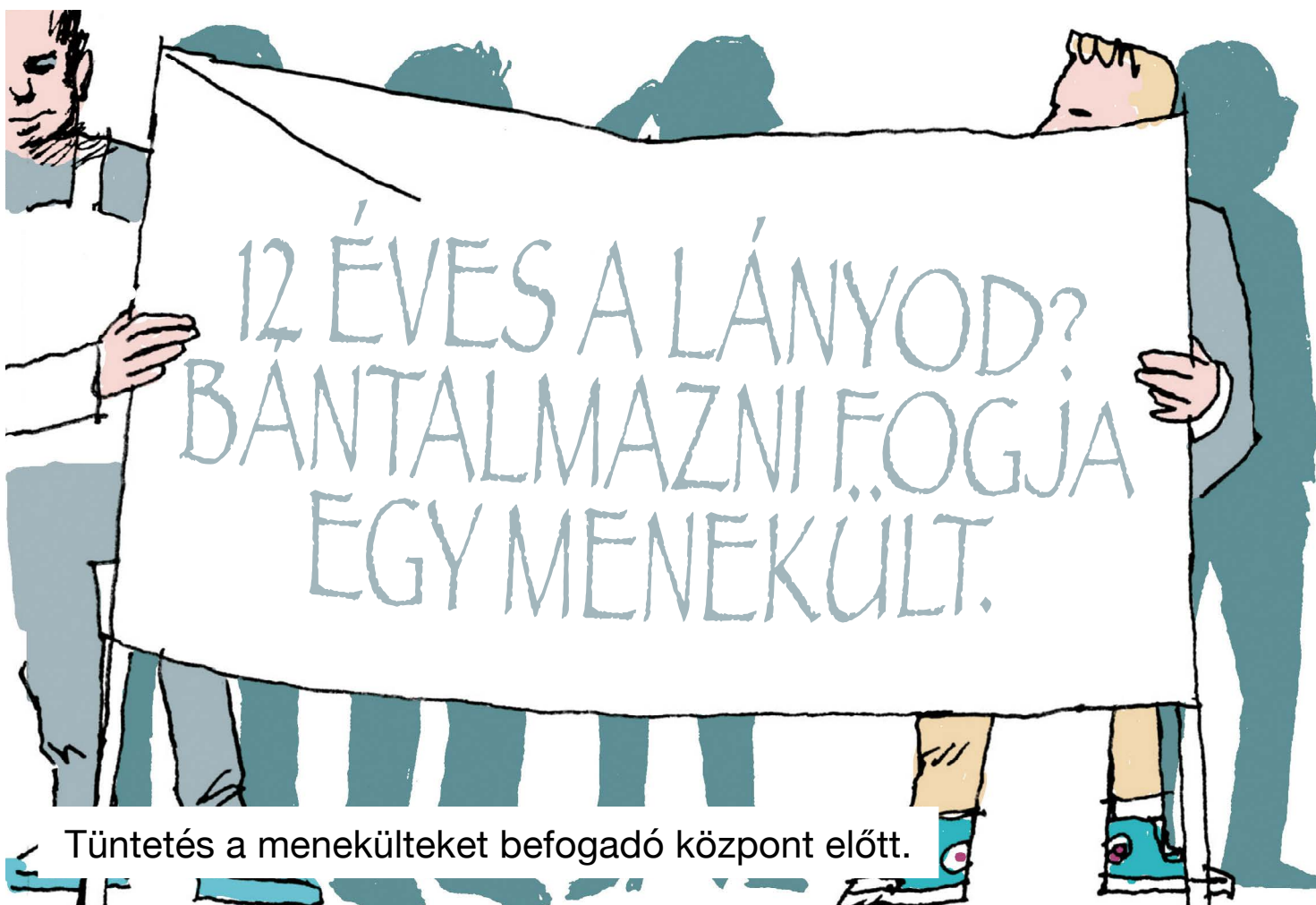
Tüntetés a menekülteket befogadó központ előtt.